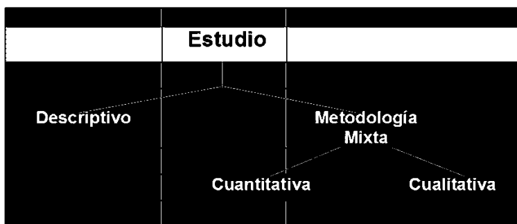
Figura 1. Diseño metodológico del proceso de investigación

Esta investigación toma como punto de referencia el trabajo realizado previamente en el libro “Verdades de papel y recuerdos vivos” (Paniagua, 2015) correspondiente a la investigación realizada con base en los expedientes del Organismo Judicial que sistematizó graves violaciones a los derechos humanos y crímenes de lesa humanidad acaecidos en los departamentos de Huehuetenango y Quiché, y debido a la cantidad e importancia de los datos el equipo decidió crear un método que le permitiera profundizar en el análisis de los datos. Para ello se planteó el siguiente diseño metodológico: