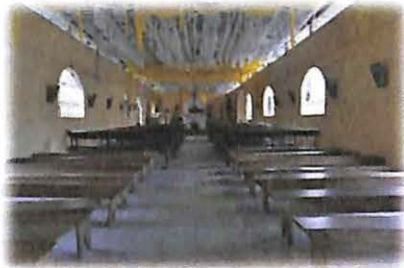
Comunidad de Cuyuta