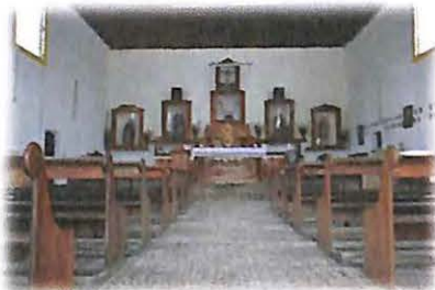
Comunidad de Obero