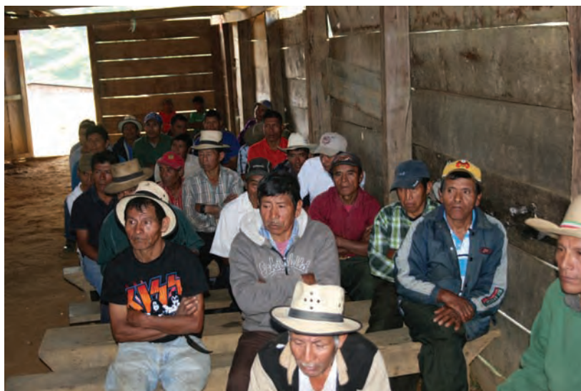
Indumentaria actual de los hombres ixiles. Foto CAFCA 2014