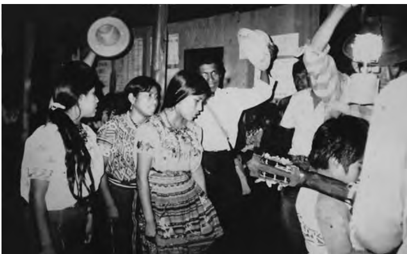
Fotografía restaurada, proporcionada por Dominga Oxlaj Carrillo