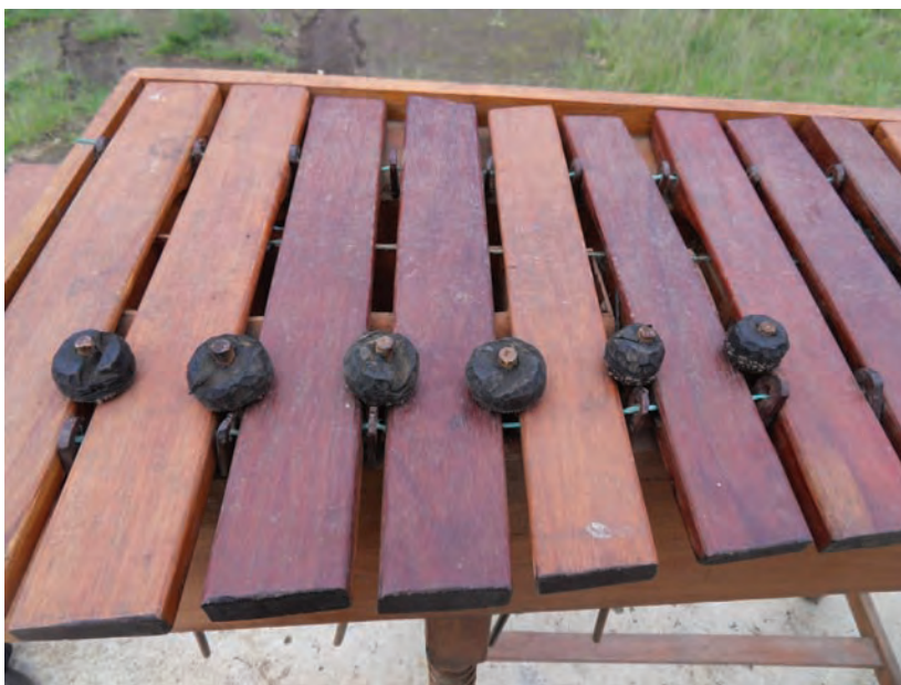
Baquetas construidas con restos de neumático. Comunidad Las Flores Turanza, Nebaj, El Quiché.