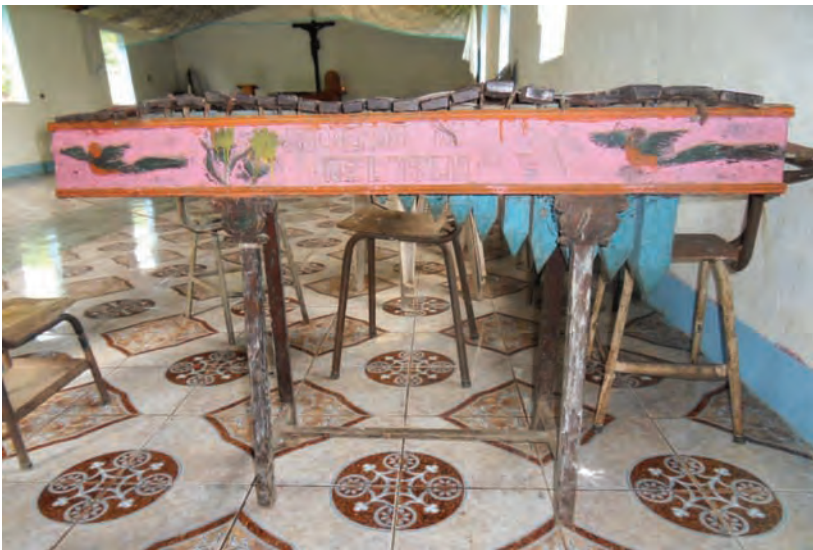
Estado de la marimba de la comunidad El Tesoro, agosto 2014.