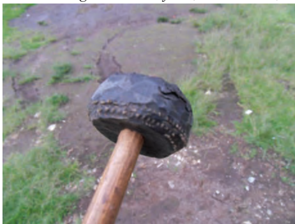
Baquetas construidas con restos de neumático. Comunidad Las Flores Turanza, Nebaj El Quiché.