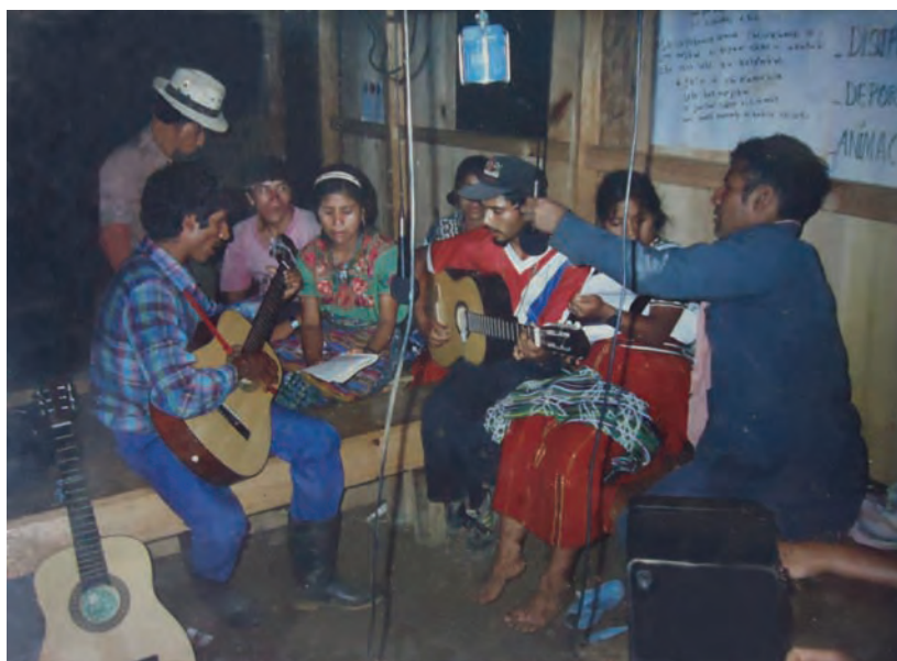
Fotografía restaurada, proporcionada por Dominga Oxlaj Carrillo