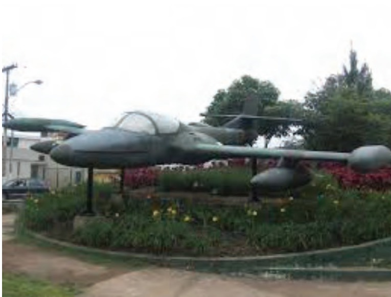
Avión A-37B Dragonfly. Av. Las Américas y 11 calle zona 13. Guatemala 31

“El día 19 de diciembre de 1989, un avión cessna A-37 B, de la Fuerza Aérea Guatemalteca sobrevoló la comunidad Santa Rosa Xeputul de la CPR de la Sierra [...] a las 11 de la mañana la unidad aérea lanzó una bomba de 550 libras... murieron cuatro civiles, mujeres. Otros dos fallecieron ese mismo día en Chaxá, aldea cercana a Santa Rosa, a causa de otra bomba arrojada por el avión.” 30