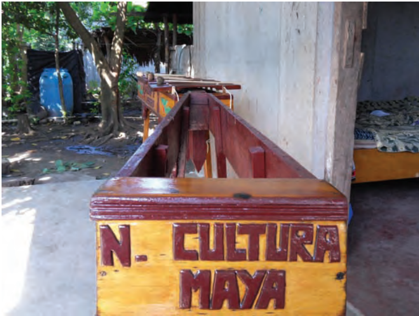
Marimba restaurada con sus respectivas baquetas. Octubre, 2014.