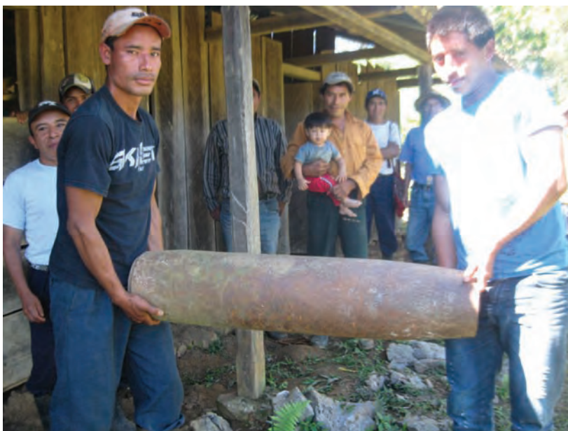
Casquete de bomba. Comunidad Antiguo Amajchel, Chajul El Quiché. Foto CAFCA, mayo 2014.

“Por el tiempo que perduraron y la gran cantidad de gente que reunieron, las CPR representan en el tiempo una experiencia crucial de quienes se vieron forzados a desplazarse a la montaña. Su implantación resalta como las estrategias de sobrevivencia se entendía no solo como mera subsistencia física, sino como una unidad familiar o como factor de identidad cultural y comunitaria, que conllevó la determinación de resistir. Hemos sufrido bastante, hemos conocido las bombas de 500 libras que se mueve la tierra y destruido la selva, hemos resistido, hemos vivido, pero hemos sufrido bastante... ” 29