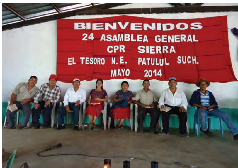
Junta Directiva CPR-Sierra 2014