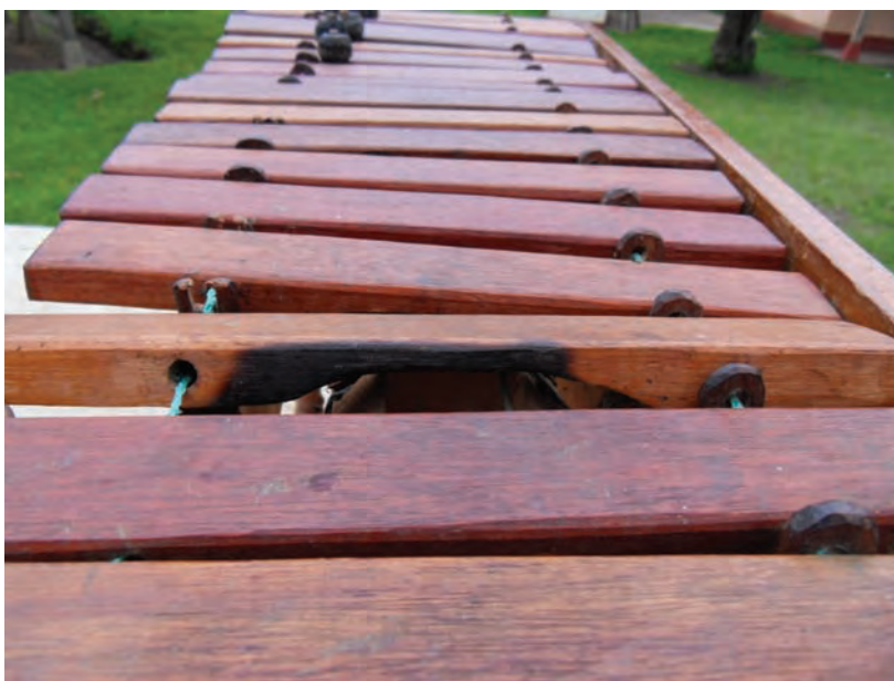
Marimba salvada del fuego y ya restauradas las teclas más dañadas. Comunidad Las Flores Turanza, Nebaj El Quiché. Foto CAFCA mayo 2014.

... Sí la quemaron, nosotros nos logramos salir, ahora la marimba se quedó ahí, el Ejército llegó y como que le dio cólera también, el Ejército no le gusta porque andaba ahí sufriendo para masacrar a uno y otro haciéndole fiesta, como burla para ellos y por eso que lo quema también. (Entrevista José Cobo, Tzabal, 09-04-2014).