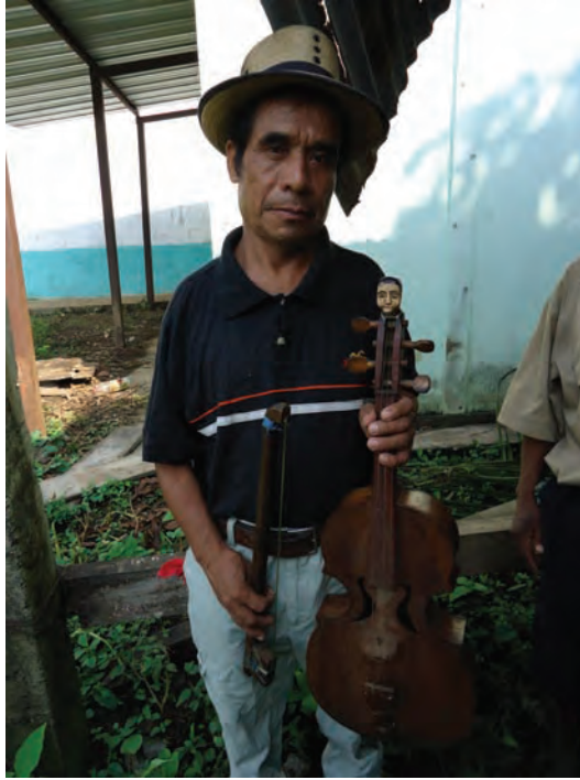
Violín usado por la Comisión de animación y en la actualidad por la CPR-Sierra. Comunidad El Tesoro Nueva Esperanza, Patulul, Suchitepéquez. Fotografía CAFCA, mayo, 2014.

Como se puede apreciar, los instrumentos llegaron a tener sus características particulares, en el presente caso y en la parte superior del violín está tallada una cabeza con rostro de hombre, el empeño dedicado prueba que la música como los instrumentos llegaron a formar parte de ellos también porque fue otro elemento de su identidad.