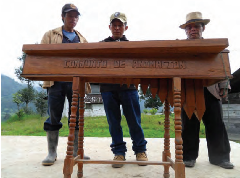
Marimba salvada del fuego y ya restaurada. Comunidad Las Flores Turanza, Nebaj, El Quiché. Foto CAFCA, mayo, 2014.

La primera está actualmente en la comunidad Las Flores Turanza en el municipio de Nebaj, departamento de El Quiché. Al momento de saber que se encontraba en ese lugar, se contactó con los responsables del resguardo del instrumento. Al verificarla se pudo constatar que está en perfectas condiciones porque en la comunidad tomaron la iniciativa de restaurarla ya que fue presa de las llamas en algún momento de la historia. El uso no es constante porque cuentan con una marimba de mayores dimensiones y es la que utilizan para las celebraciones locales, pero en aras de darle cumplimiento a las recomendaciones de las últimas dos Asambleas de la CPR, los comunitarios tratan de identificar a los potenciales responsables y retomar las comisiones de animación.