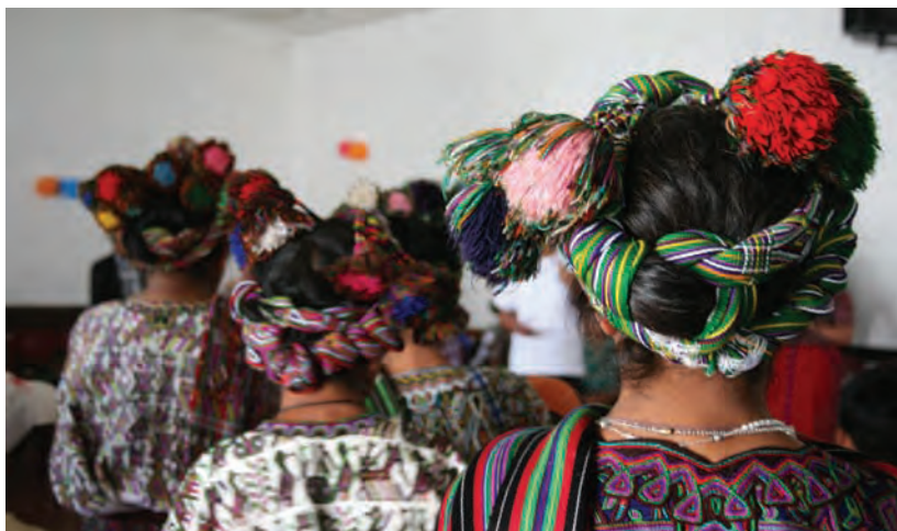
Cinta usada por las mujeres ixiles. Foto CAFCA 2014

El pantalón regularmente es utilizado por los ancianos y en ocasiones especiales o ritos ceremoniales. Los las generaciones actuales son las que menos uso le dan al traje regional debido a la transculturación generalizada, pues es importante señalar que en los tres municipios existen ventas de ropa usaba conocida como “pacas”, lo que ha contribuido ha que la indumentaria sea de moda occidental.