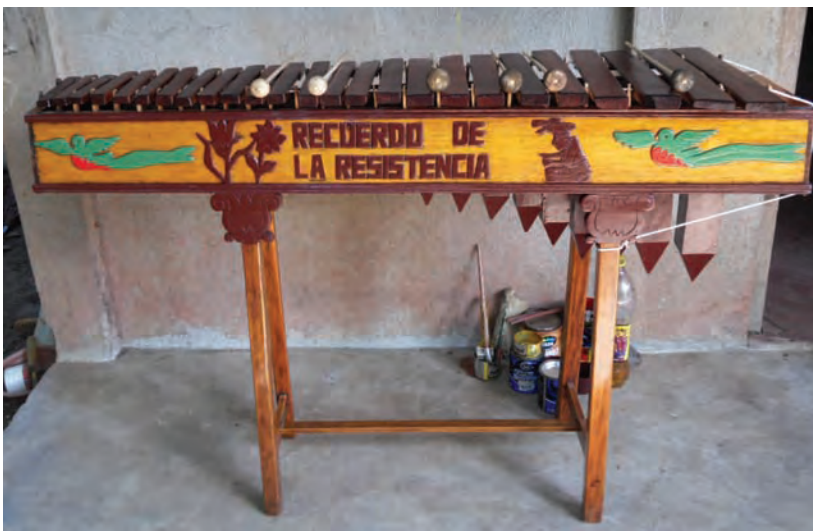
Marimba restaurada con sus respectivas baquetas. Octubre 2014