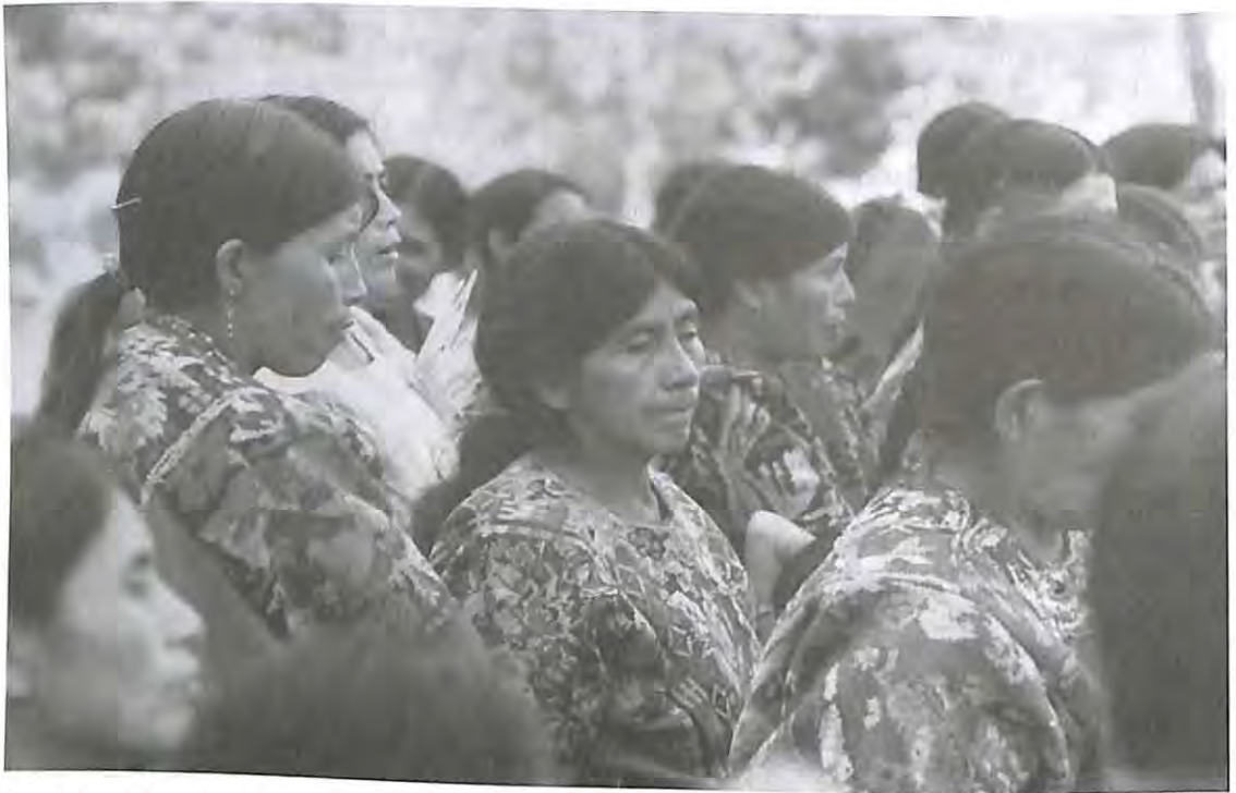
Familiares luchan hasta recuperar los restos de las víctimas del Conflicto Armado Interno.

Las medidas de reparación colectiva a deudos y sobrevivientes de violaciones de derechos humanos y hechos de violencia colectivos han de ser cumplidas en el marco de proyectos orientados a la reconciliación con enfoque territorial, de modo que, además de propiciar la reparación, sus acciones y beneficios recaigan sobre la totalidad de la población del territorio, sin diferenciar entre víctimas y victimarios.