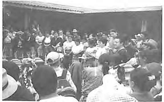
Entrega de víctimas asus familiares por la FAFG y jueza de paz San Pedro Jocopilas, El Quiché.

La recopilación de los datos se llevó a cabo en dos fases: la primera durante los meses de noviembre y diciembre del año 2003 a través de tres visitas de campo a las comunidades de Chontalá y San Andrés Sajcabajá en el departamento de Quiché y Paley en Chimaltenango. La segunda fase se realizó durante el mes de noviembre del año 2004, a través de cinco visitas de campo a las comunidades de Zacualpa y San Pedro Jocopilas en El Quiché y San Juan Comalapa en Chimaltenango.