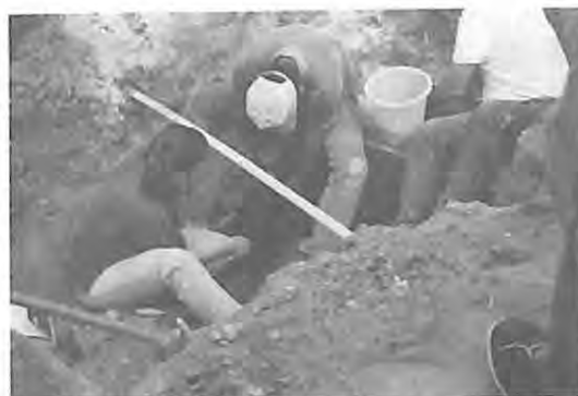
Exhumación en fosa clandestina en Chontalá Chichicastenango, El Quiché.

Una de las motivaciones más importantes a nivel comunitario para solicitar los procesos de exhumación, es la de demostrar que se cometieron un sin fin de vejaciones durante la época del Conflicto Armado Interno, con el fin de que el Gobierno, la sociedad y especialmente las generaciones más jóvenes tengan una prueba concreta y cruda de la experiencia sufrida por los pueblos indígenas, ya que la violencia implicó un silencio obligado entorno a los delitos cometidos por el Estado.