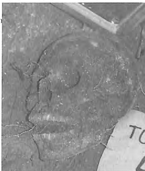
Exhumación de víctimas en cementerio clandestino San José Pacho, Lemoa, El Quiché 1992.