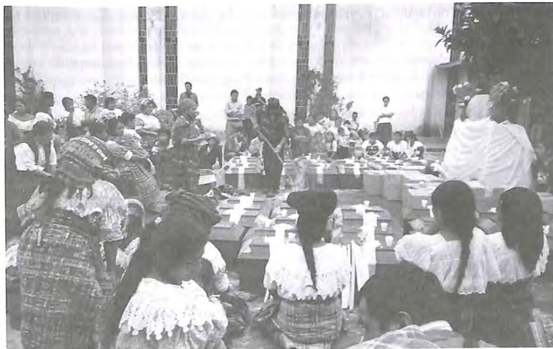
Bienvenida a las víctimas a través de ceremonia maya por las familias en San Pedro Jocopilas, El Quiché.