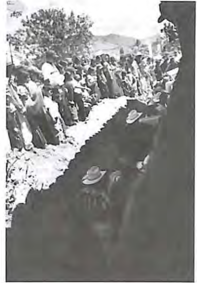
Familiares de las víctimas en el cementerio de San Andrés Sajcabajá.

Hay algunas personas que dicen que ya para qué, para qué hacer un trabajo de exhumaciones, -¿por qué eso?-, porque los huesos ya no sienten, que eso ya pasó, y ya es pasado.” (Paley)