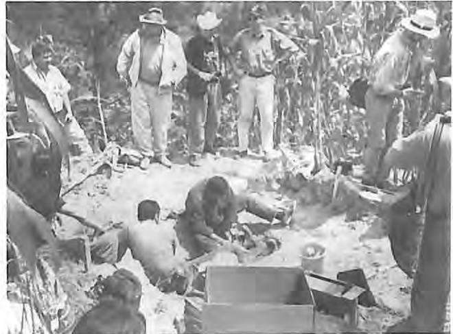
Exhumación en cementerio clandestino con delegados internacionales, 1992.

"Muchas niñas se quedaron huérfanas. Unos fueron huérfanos porque se quedaron sin papá, pero muchos, muchas niñas se quedaron sin papá, sin, mamá, entonces ese es el problema. El otro problema para los jóvenes es cuando empezó la guerra fuerte internamente, los jóvenes no tienen libertad de ir al mercado, no tienen libertad de viajar a otras regiones, no tiene libertad de venir aquí en la ciudad, porque en cualquier momento los llevan al cuartel. Entonces era una inseguridad grande para ellos, ya no son libres, se encerraron los jóvenes. Que no es que quieran ir al cuartel, están forzados para ir al cuartel" (Junta Directiva Local)