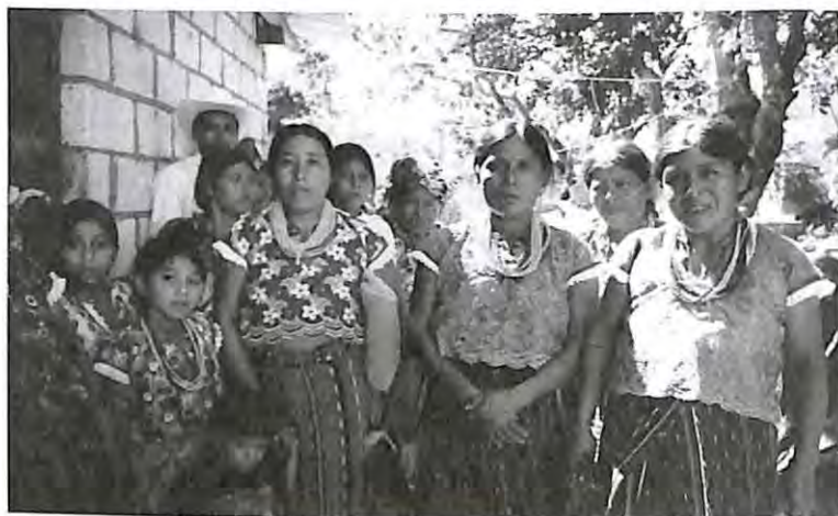
Familiares de las víctimas listas para recibir las osamentas.