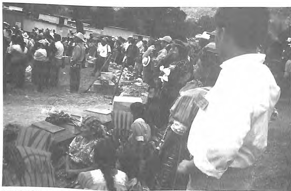
Osamentas listas para ser colocadas para el entierro digno, cementerio de Zacualpa, El Quiché.

Se hace una investigación de escena, que es parte de la fase de Arqueología Forense que inicia con la ubicación de fosas, en las áreas previamente señaladas por testigos y familiares, ante un representante del MP y arqueólogos de la FAFG. Ello con el fin de detectar posibles fosas, a través de alteraciones en el terreno, realizando trincheras exploratorias. Al ubicarse las fosas se procede a la excavación, estableciendo los bordes para determinar la dimensión de las mismas, confirmando la presencia de restos óseos humanos, analizando el relleno y sus alteraciones, entre otros. De esta forma se ubican evidencias óseas y artefactuales, procediendo a la limpieza y registro de las fosas.