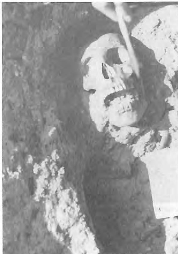
Exhumación de víctimas en cementerio clandestino, 1993.