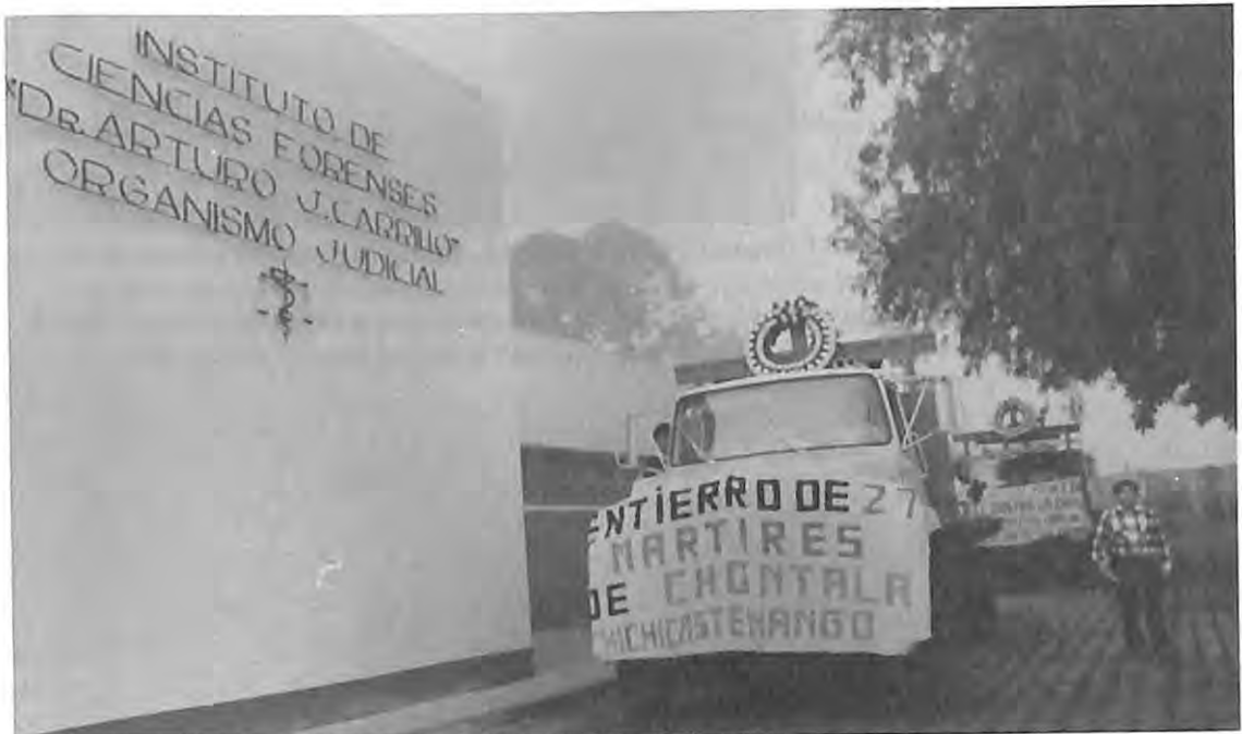
Entrega de osamentas en juzgado, Chontalá, Chichicastenango, El Quiché, en 1992.

“(...) Como ya saben que somos CONAVIGUA ya no dicen nada, por ejemplo, si el auxiliar que nos acompaña está con nosotros, (...) no nos dicen nada, pero cuando se inicia la exhumación, o vamos solitos, allí si no nos atienden, nos hacen más preguntas; una vez me fui sola con una compañera y dijimos que éramos de CONAVIGUA y no nos