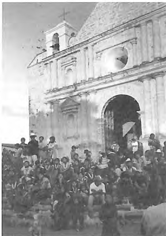
Familias esperan para salir al entierro, San Andrés, Sajcabaja, El Quiché.