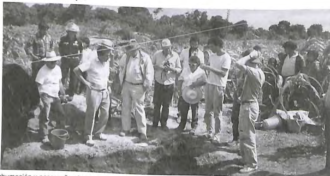
Exhumación y acompañamiento de autoridades, personas de solidaridad y familias de las víctimas en Chontalá, Chichicastenango, El Quiché.

“(...) pero en mi caso yo lo hago porque mi papá y mi esposo se fueron por la violencia, entonces mi idea es que a lo mejor los voy a ver, aunque no sé por dónde. No los dejaron en un solo lado, porque muchos aparecieron aquí, pero eran de otros lados; es por eso que nunca se identifica a todos los exhumados. Entonces por eso yo pienso que uno sólo puede comunicar esto a quien lo entiende.” (Grupo focal Comalapa)