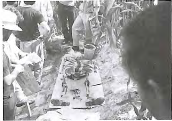
Osamenta recuperada durante la exhumación en Chontalá, Chichicastenango, El Quiché.

En las sociedades que han sufrido a causa de la violencia organizada, el intentar esclarecer la historia puede suscitar una grave desconfianza en las personas propias o extranjeras a las comunidades que emprendan esta empresa.