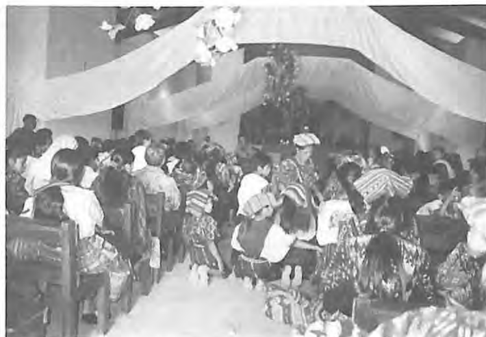
Inhumación 2004, Estanzuela, Joyabaj, El Quiché.

La información recopilada en estas comunidades fue complementada a través de entrevistas realizadas con organizadoras comunitarias de CONAVIGUA, para conocer los aspectos de organización y pasos de las exhumaciones a nivel comunitario; así como entrevistas con la asesora jurídica de la organización y dos procuradores, quienes proporcionaron la información sobre los aspectos legales de los procesos de exhumación