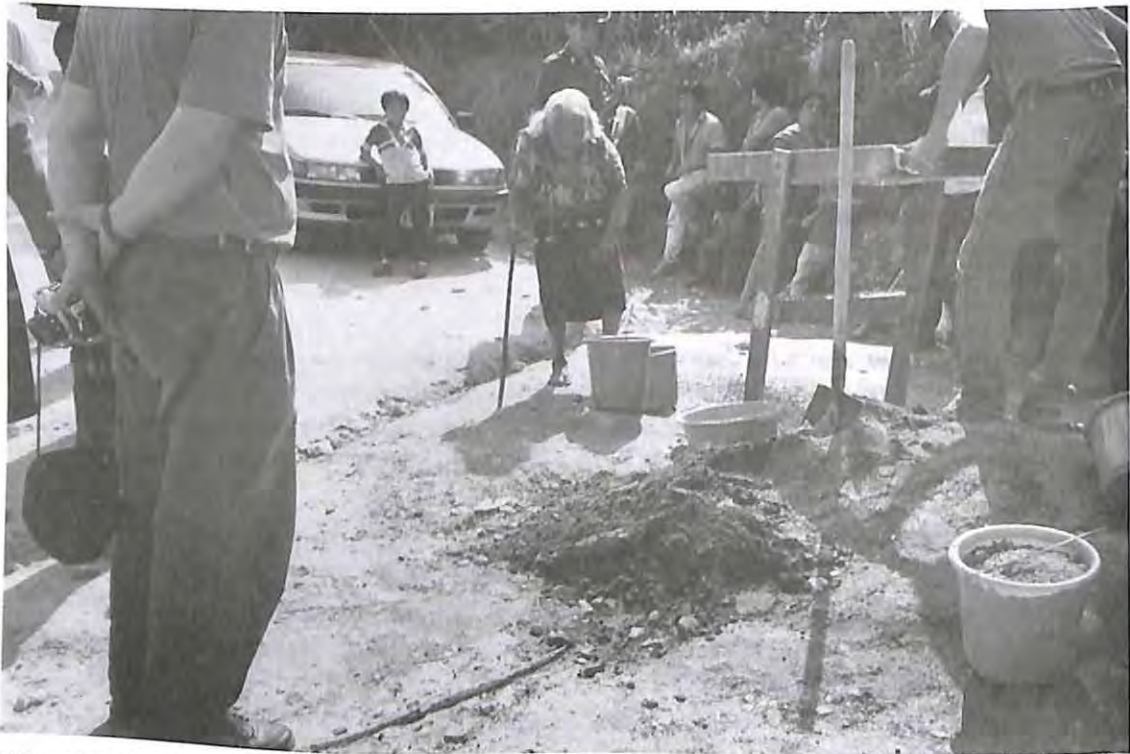
Ubicación en la fosa donde descansan las víctimas en cementerio clandestino en Chontalá, Chichicastenango, El Quiché.