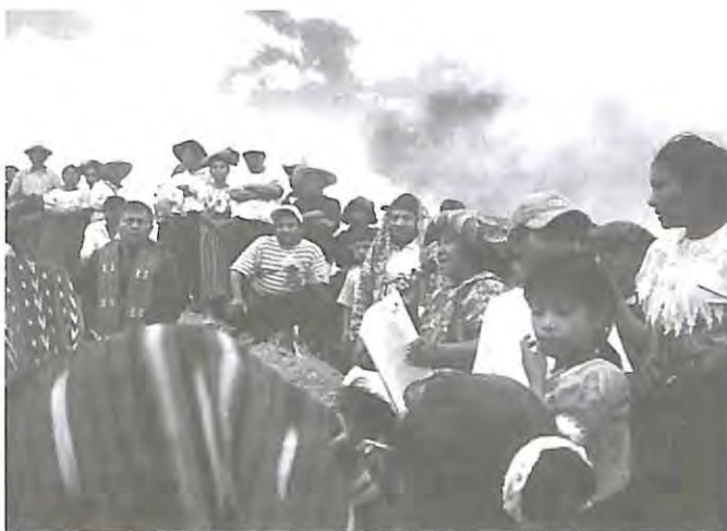
Entierro de las víctimas. El Quiché., las víctimas son ya colocadas en el lugar donde descansaran para siempre, Zacualpa 2002.

Desde su fundación en septiembre de 1988, la Coordinadora Nacional de Viudas de Guatemala, CONAVIGUA, ha trabajado en las comunidades del interior del país buscando el bienestar, la dignificación y la reivindicación de los derechos de los pueblos mayas, y dentro de ellos especialmente los de la mujer, que fue y continúa siendo una de las mayores víctimas, no solamente del conflicto armado, sino de la discriminación étnica y genérica.