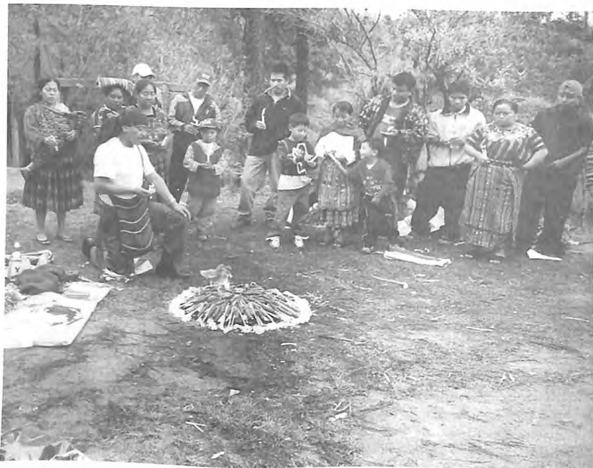
Ceremonia maya antes de la exhumación en ex destacamento de Comalapa, mayo 2004.

Asimismo, el estudio revela las consecuencias, a nivel personal y comunitario, de la participación en las exhumaciones y su relación con el proceso de duelo. Tomando en cuenta la creación oficial del Programa Nacional de Resarcimiento, el estudio da una idea de la información y expectativas de las comunidades entorno a este. Finalmente, se analizan los procesos legales que confluyen en la petición y desarrollo de los procesos de exhumación.