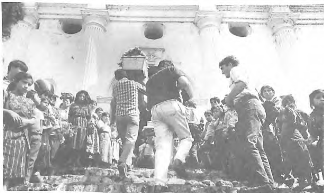
Ingreso en la iglesia católica de Chichicastenango, El Quiché.

Las Organizadoras intentan convencer a las personas a que apoyen y sean parte activa en las exhumaciones. Al principio