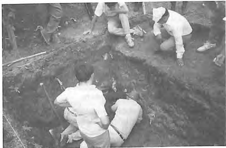
Exhumación en fosa clandestina en Chontalá, Chichicastenango, El Quiché.

“Para que se sepa que fue lo que pasó, para que la gente no se olvide de la violencia y que los más pequeños vean, aprendan de lo que pasó y estén preparados para que eso no vuelva.” (Grupo focal Zacualpa)