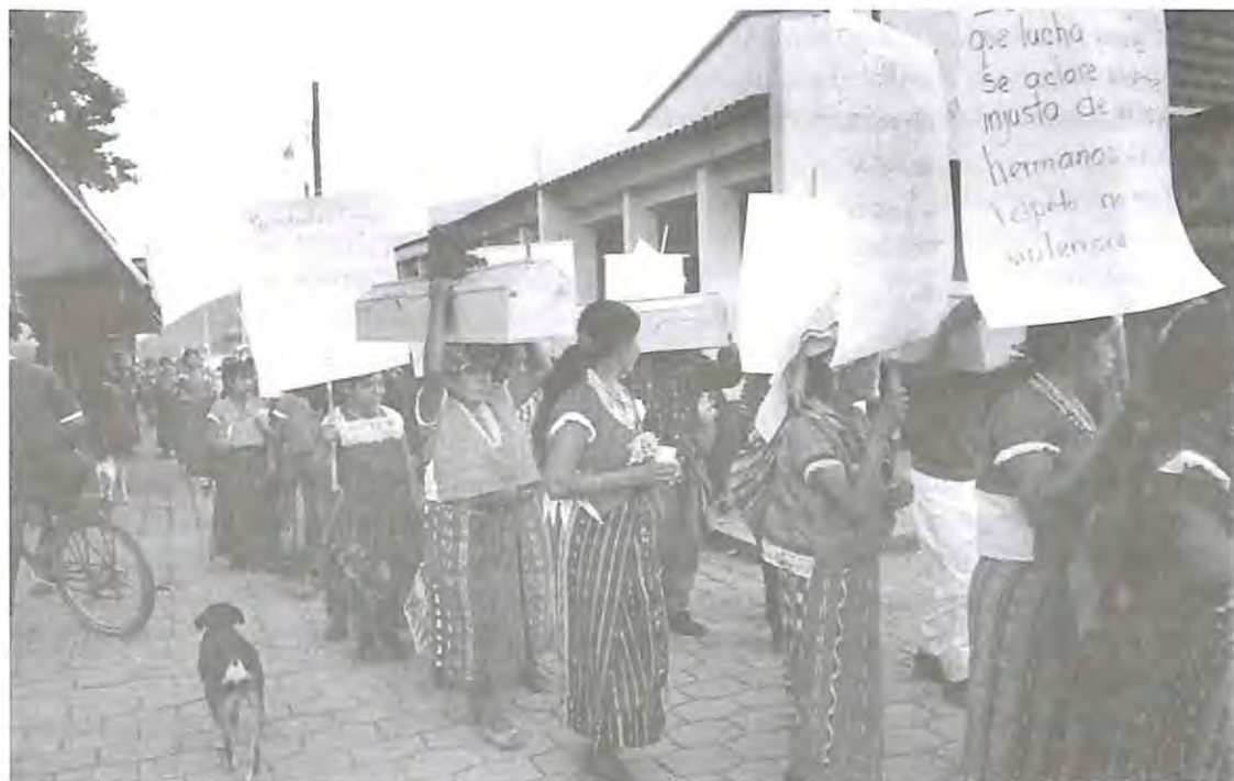
Última caminata de familias en compañía de los víctimas para el último adiós cementerio de San Andrés Sajcabajá, El Quiché.

La dignificación de las víctimas, incluye además de la sepultura en un lugar apropiado y de conocimiento público, el reconocimiento de la violencia ejercida en su contra y por lo tanto, de su identidad y existencia, así como la declaración de la inocencia de las víctimas que fueron ejecutadas al ser consideradas como una amenaza a la estabilidad nacional.