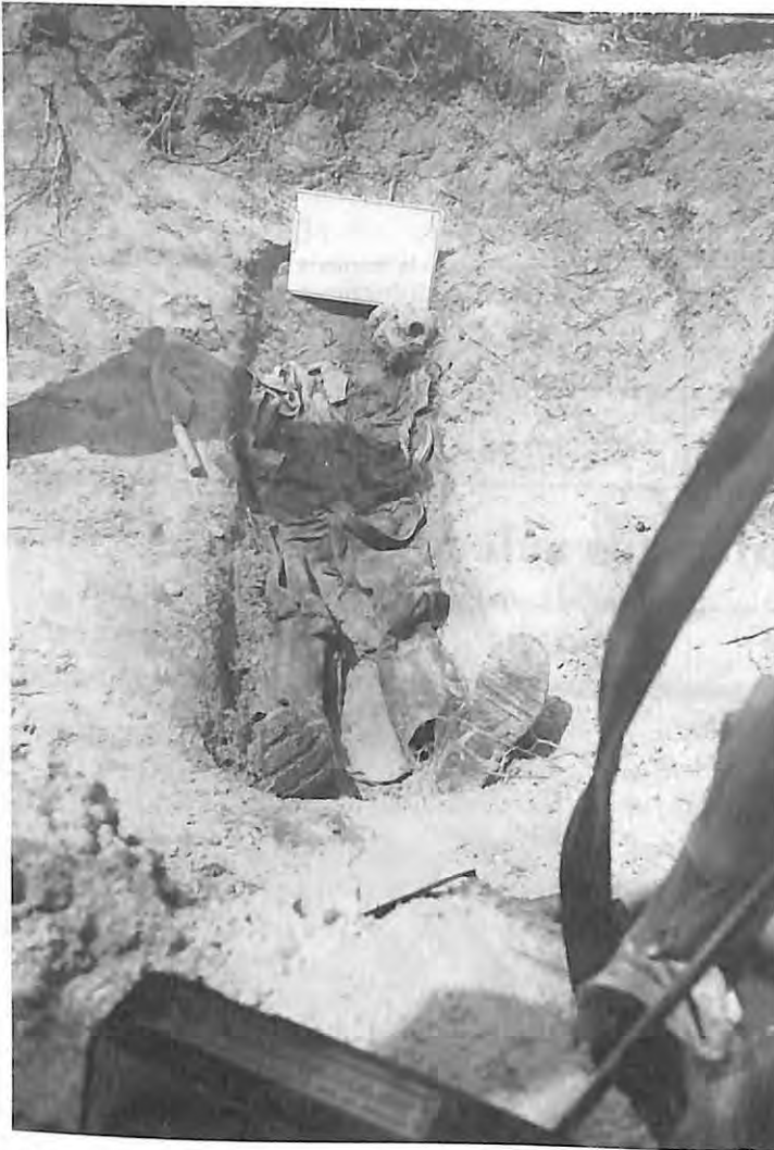
Ubicación de la víctima dentro de la fosa clandestina en Chontalá Chichicastenango, El Quiché.

Por ello se procedió a realizar los grupos focales e historias de vida únicamente con personas que hubieran perdido algún familiar y se encontraran participando en algún