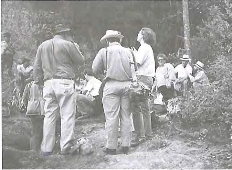
Exhumación en San José Pacho, Lemoa, El Quiché, 1992.

“Cuando mi papá cumplió un año, nos llevaron y nos enseñaron los ex PAC de la comunidad, como yo antes en el parque estaba. Nos hicieron el favor de enseñarnos ellos dónde estaba y fuimos allá con ellos y le llevamos sus flores y le dejamos un jarro. Cuando estábamos allí ellos nos enseñaron la tumba y cuando les dijimos será que podemos nosotros venir a visitar. Nos dijeron que no podíamos, porque todavía estaba vivo el jefe de patrulla, -“y si los mira por aquí, talvez los va a matar”-. Entonces dijimos que estaba bueno, que no llegamos allá dónde lo enterraron. Después cuando ya empezamos la reunión con las compañeras de aquí, yo fui a ver entonces ya no estaba la tumba y como hicieron asfalto en la carretera a Sacapulas. Le dije a mi hermana, la más mayor que fuera conmigo, a ver el mero lugar dónde estaba. Ví que la tumba ya no estaba, que ya estaba plana, que le habían salido unos arbolitos. , Entonces ella me decía que nuestro papá ya no está aquí porque tal vez lo sacaron. Cuando estábamos paseando encontramos unos caites y cuando a él lo fueron a traer... entonces ella me decía que eran de él.”- Por gusto vas a andar y andar, por gusto vas a trabajar-”, me decía ella. Yo no me quedé conforme (...)” (Historia de vida San Pedro Jocopilas)