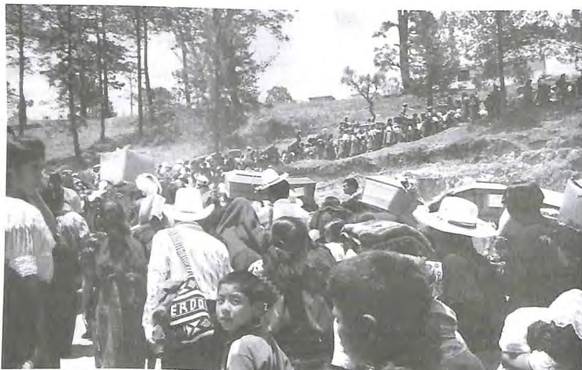
Las víctimas son llevadas en procesión, acompañadas de familiares y de comunidad para despedirlos, Zacualpa, Quiché.