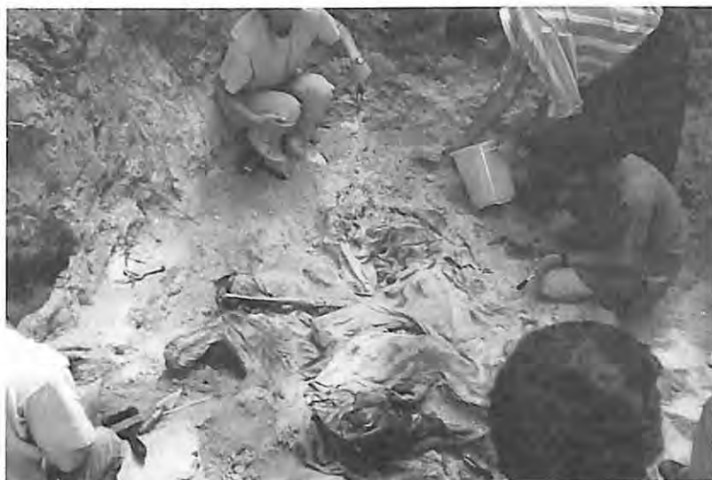
Exhumación en cementerio clandestino..

La desaparición de un pariente es una pérdida que no puede llorarse adecuadamente. El hecho de no poder realizar un funeral es traumatizante tanto en casos de desapariciones como en el de personas que han sido asesinadas brutalmente.