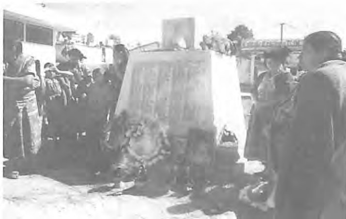
Dignificando la memoria de las víctimas en el día de los difuntos. Comalapa, Chimaltenango.

Las comunidades fueron seleccionadas por la coordinadora responsable del proyecto con el apoyo del equipo técnico de CONAVIGUA, tomando en cuenta los siguientes aspectos: Que hubiera representatividad de diferentes grupos étnicos, número de víctimas identificadas en la exhumación y organización comunitaria para apoyar el proceso de recopilación de datos.