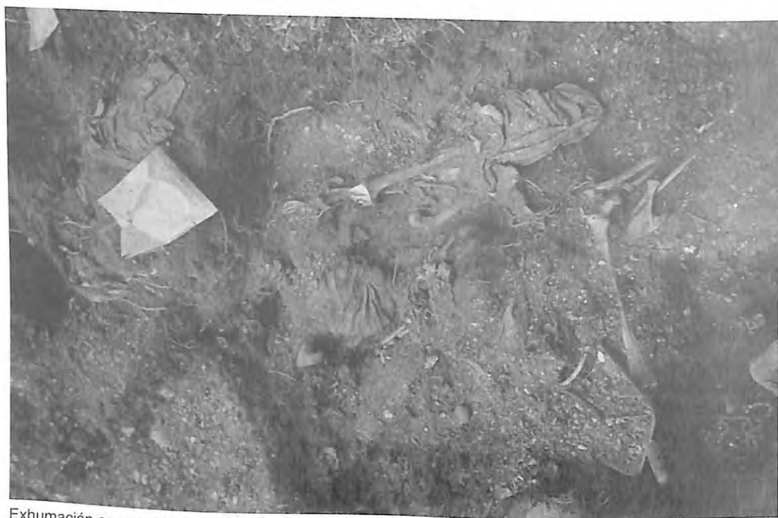
Exhumación en cementerio clandestino, 1993.