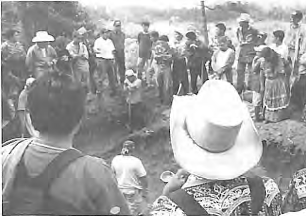
Exhumación en ex destacamento de Comalapa, mayo 2004.

Durante el Conflicto Armado, las desapariciones forzosas y la violencia masiva fueron de la mano con la aparición de fosas clandestinas en las cuales se enterró a las víctimas, intentando negar su existencia y el destino de estas durante los años de violencia. Esto implicó que los familiares y sobrevivientes no pudieran realizar los ritos funerarios que permiten a los individuos reaccionar ante la pérdida y la muerte de un ser querido.