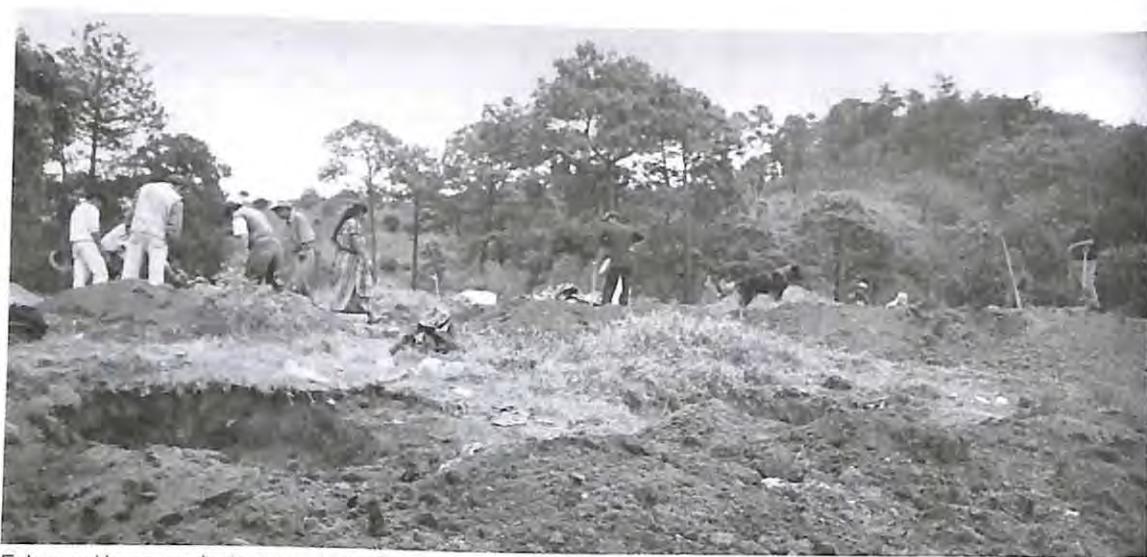
Exhumación en ex destacamento de Comalapa, mayo 2004.

“Ellos mismos solicitaron a CONAVIGUA para que haya un entierro digno para los difuntos.” (San Andrés Sajcabajá)