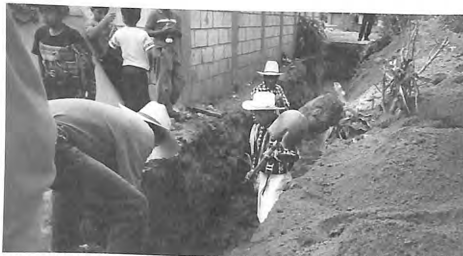
En este lugar se exhumaron algunas de las víctimas de San Andrés Sajcabajá, El Quiché.

“La compañera dice que no han recibido ayuda por parte del gobierno, han recibido algunas casas por el programa piloto de resarcimiento... pero estamos claras que no a todas las familias víctimas, porque fueron contadas las casas que se dieron y no fue para todos.” (Paley)