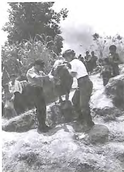
Una anciana hace lo imposible para llegar donde se realizan las exhumaciones de los seres queridos en un cementerio clandestino de Chontalá, Chichicastenago, El Quiché.

“Allí cuando hicieron el trabajo, cuando empezó la exhumación, no hubo problema por que las comunidades estaban contentas, la gente los fue a recibir, les contaron como fue la violencia en la comunidad, no hubo problema” (Paley)