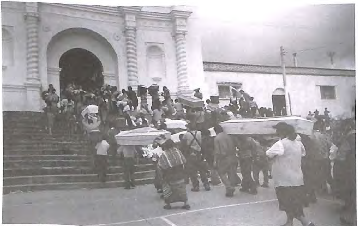
Ingreso de las víctimas en la iglesia católica de San Pedro Jocopilas. El Quiché.

Cada uno de los medios de prueba recabados debe ser claro y preciso, para que el Juez, al momento de resolver, tenga bases claras sobre las cuales poder fallar correctamente. La recopilación de los medios de prueba, en el trámite legal para autorizar una exhumación es larga, ya que pueden ser numerosos y porque se realiza una demanda en la que cada interesado de la comunidad, debe probar la existencia de sus desaparecidos durante el Conflicto Armado Interno.