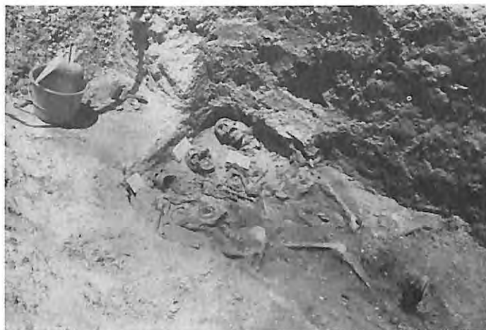
Exhumación en San José Pacho, Lemoa, El Quiché, 1992.