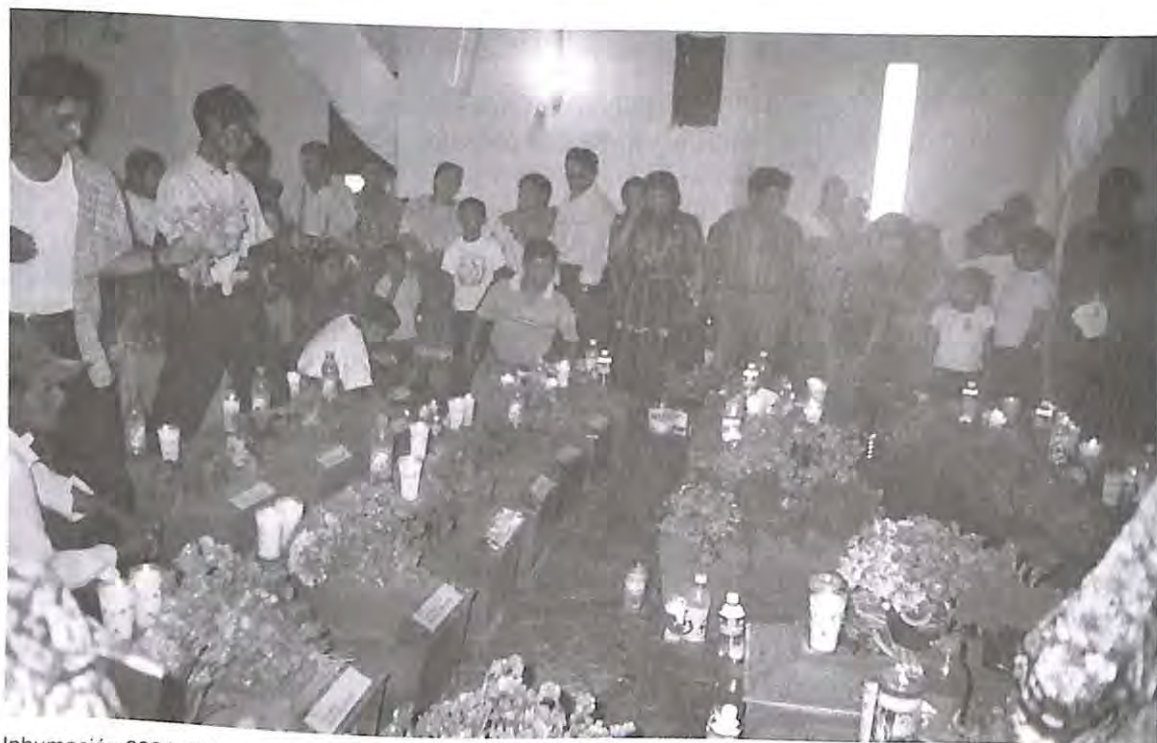
Inhumación 2004, Estanzuela, Joyabaj, El Quiché.