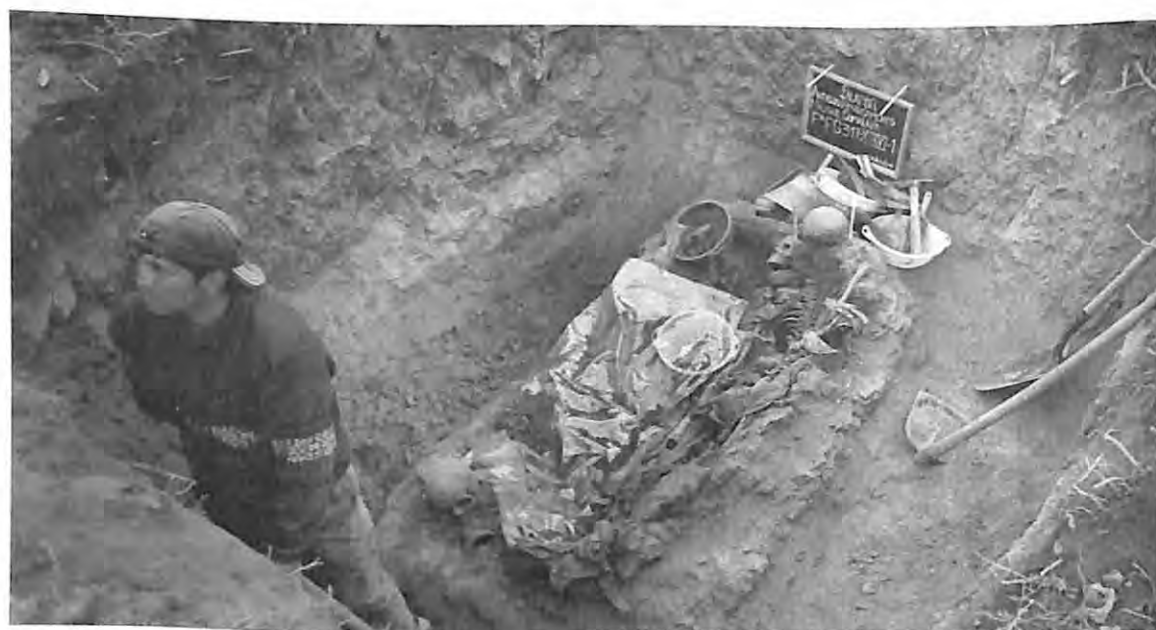
Exhumación en ex destacamento de Comalapa, mayo 2004.

“Para que se vea lo que pasó, para que nos reconozcan todo la violencia que vivimos y que a veces nos dicen que estamos locas, que para qué queremos que eso se vea, si sólo son huesos, pero es bueno que se saquen, que la gente vea lo que pasó.” (Grupo focal Comalapa)