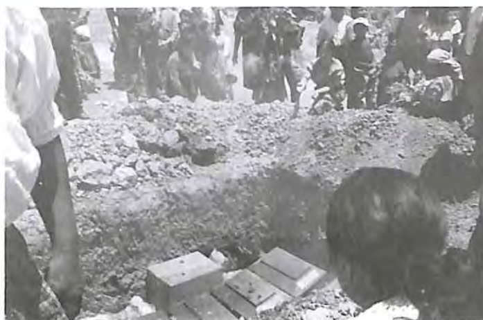
Inhumación de restos de San Antonio Sinaché, en el cementerio de Zacualpa 15 de abril de 2004.

Todo trámite de exhumación se debe llevar a cabo en la fase de investigación, dentro del procedimiento penal que se haya iniciado, con la denuncia de la muerte del que se pretende exhumar.