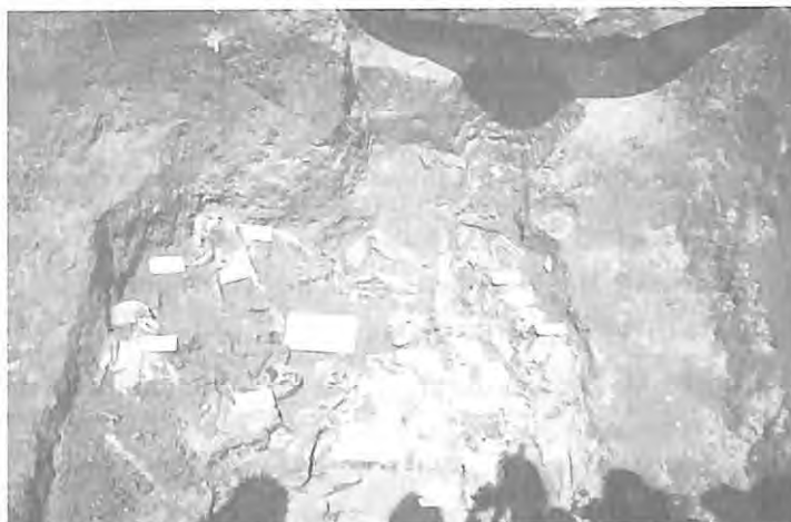
Exhumación de las osamentas en cementerio clandestino, 1993.

Con ello fue posible alcanzar un número de 101 personas, entre mujeres y hombres, familiares de víctimas desaparecidas durante el conflicto armado interno. Las sesiones se llevaron a