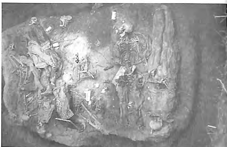
Comalapa 2004, algunas de las víctimas están para ser exhumadas de la fosa donde fueron torturadas.

III. Se agrega en esta parte la sistematización del conocimiento sobre el significado de las exhumaciones. En esta sección, los resultados se