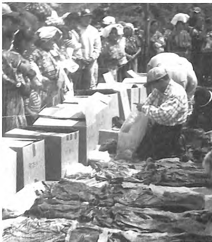
Exposición de ropa de víctimas en San José Poaquil, Chimaltenango.

Con la organización de las comunidades ya coordinada con CONAVIGUA, se puede comenzar con tal trámite. Dicho trámite está comprendido en la etapa preparatoria de un proceso ordinario por la vía penal, según el ordenamiento jurídico guatemalteco, puesto que se trata de la denuncia de desapariciones en la época del Conflicto Armado Interno, que constituyen una serie de delitos, entre los que se incluyen; asesinatos, torturas, ejecuciones extrajudiciales y genocidio. El trámite legal para realizar las exhumaciones es parte de la etapa de investigación dentro del proceso ordinario penal, lo que significa que el Ministerio Público tendrá seis meses para realizar la investigación, contados a partir de la interposición de la denuncia.