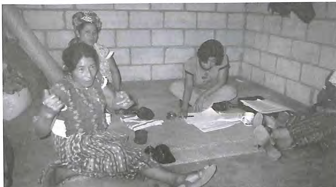
Una de las víctimas da su testimonio sobre las masacres. San Andrés Sajcabajá, El Quiché.