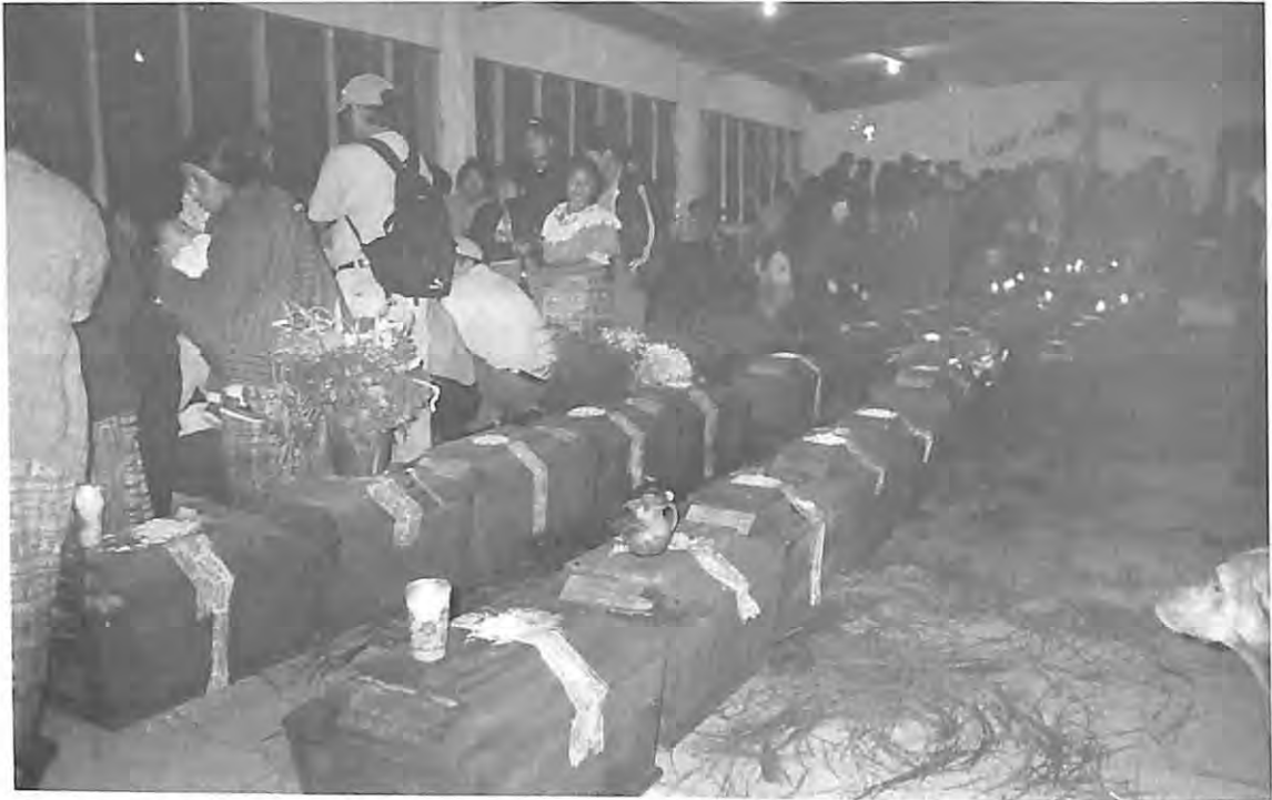
Ingreso de las víctimas en la iglesia católica de San Pedro Jocopilas, El Quiché por los familiares.

Es necesario, contar con un modelo para realizar dichos trámites, y así agilizar las diligencias que permitan encontrar a los desaparecidos. Brindarles una sepultura que dignifique además a los afectados directos por tales actos. Los interesados deben conocer el proceso legal de la exhumación, para lograr crear cierta seguridad jurídica.