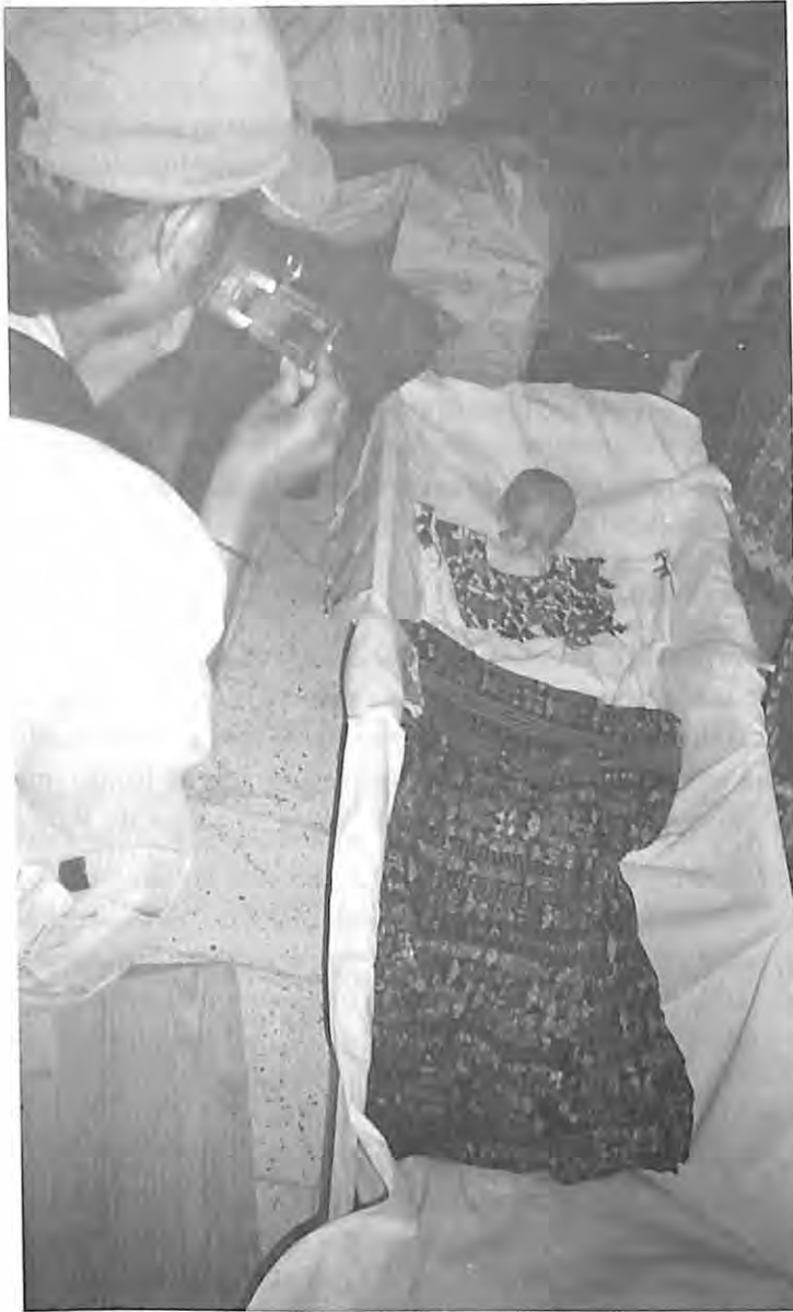
Una de las víctimas es vestida por familiares después de la entrega por los antropólogos (FAFG). San Pedro Jocopilas, El Quiché.