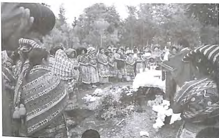
Celebración religiosa 02-noviembre-2004, ex destacamento militar, San Juan Comalapa.

A nueve años de la firma del Acuerdo de Paz Firme y Duradera en diciembre de 1996, entre el gobierno del Estado en ese año y la Unidad Revolucionaria Nacional Guatemalteca (URNG), los avances en materia de reivindicación de los derechos de los pueblos indígenas y del reconocimiento real del carácter multiétnico, multicultural y plurilingüe del país, han sido ineficientes.