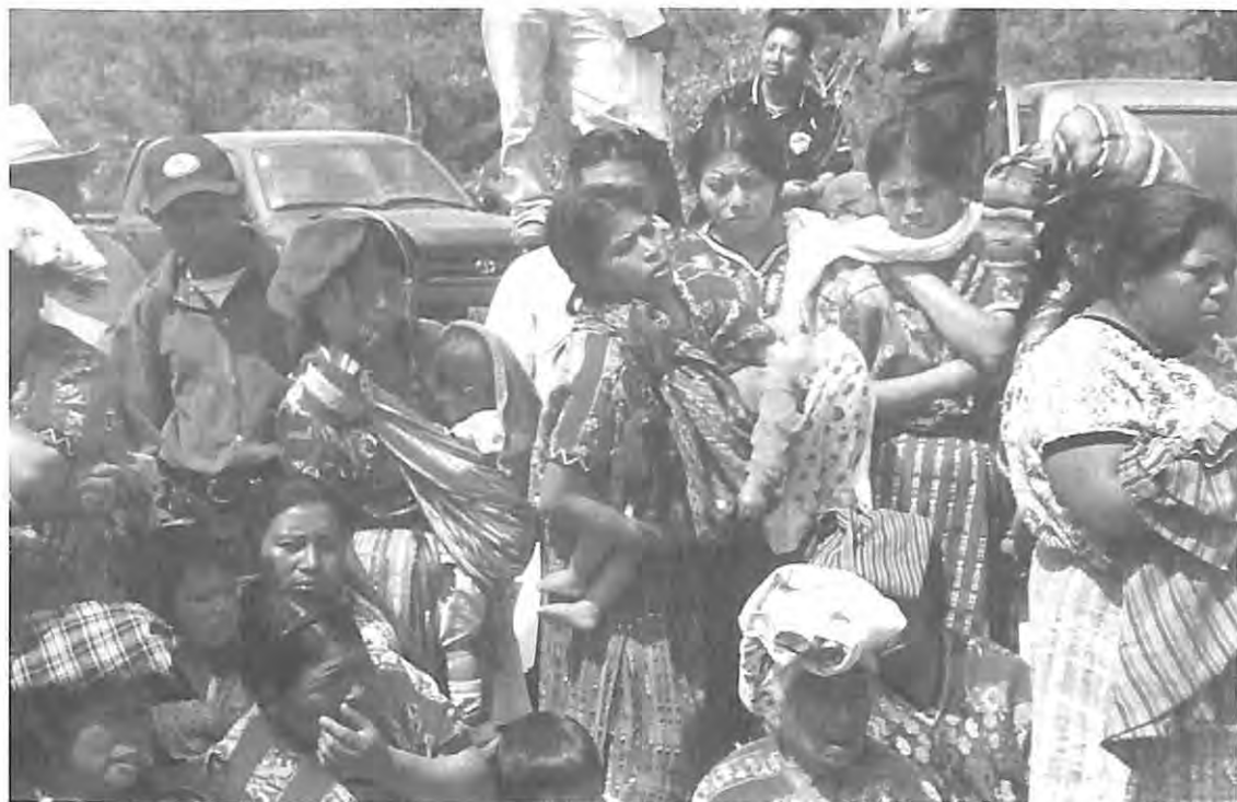
San José Poaquil, Chimaltenango, esperando la recuperación de las víctimas en el cementerio clandestino.

Cabe mencionar que cuando Ríos Montt tomó el poder, expandió los aspectos de acción civil de la contrainsurgencia, incluidas las milicias de campesinos, bajo el nombre de Patrullas de Autodefensa Civil, compuestas por habitantes de las comunidades violentadas, y que han sido señaladas de cometer violaciones a los derechos humanos y asesinatos en sus propias comunidades, quedando al final del conflicto armado comunidades muchas veces divididas entre víctimas y victimarios, en las cuales sigue presente un sentimiento de temor y desconfianza hacia los miembros de las PAC.