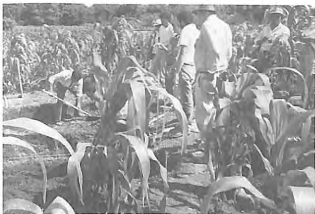
Excavación para la exhumación de las osamentas en Chontalá, Chichicastenango, El Quiché, 1992.

Según el diccionario de la Real Academia Española, exhumar significa desenterrar un cadáver o restos humanos. La definición antropológica del término