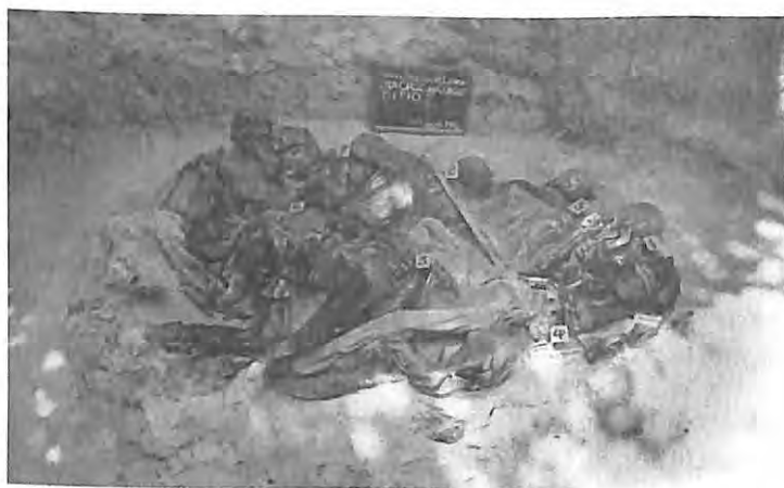
Exhumación en cementerio clandestino de San José Pacho Lemoa, El Quiché, 1992.

Las sesiones de grupos focales fueron organizadas por personal de CONAVIGUA en cada una de las tres comunidades seleccionadas, en donde también se contó con el apoyo de dos traductoras dadas los diferentes idiomas que se hablan en cada una de ellas.